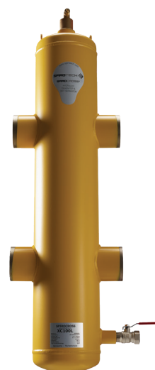
Immagine del prodotto