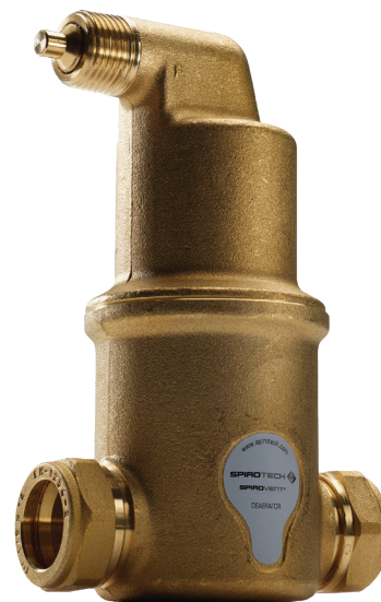
Immagine del prodotto